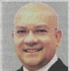
Ketua Pegawai Eksekutif OCBC Al-Amin Bank Bhd, anak syarikat perbankan Islam OCBC Bank (Malaysia) Bhd

Oleh Syed Abdull Aziz Syed Kechik bbbiz@bh.com.my